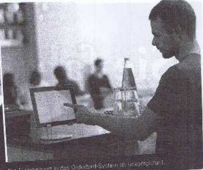
Die Einarbeitung in das Orderbird-System ist unkompliziert.

Support und Online-Reporting. »Software as a service« nennt sich das Konzept neu-deutsch – die Software wird bei den App-Anbietern quasi gemietet. Der Vorteil: Kunden erhalten Updates kostenfrei und haben ein stets aktuelles Kassensystem. Und wie die etablierten Kassensystem-Anbieter beraten viele Erfinder von Gastro-Apps auf Wunsch vor Ort, welche Lösung für den Betrieb die beste ist.